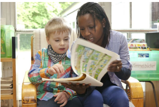
B. Hiss/DRK e.V.