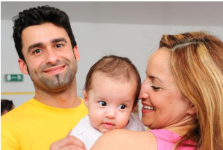
S. Freiling/DRK e.V.